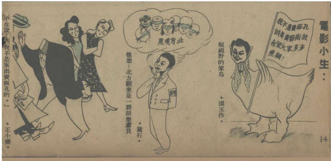
圖 2。白雲的陰柔和性傾向被《北京漫畫》醜化。