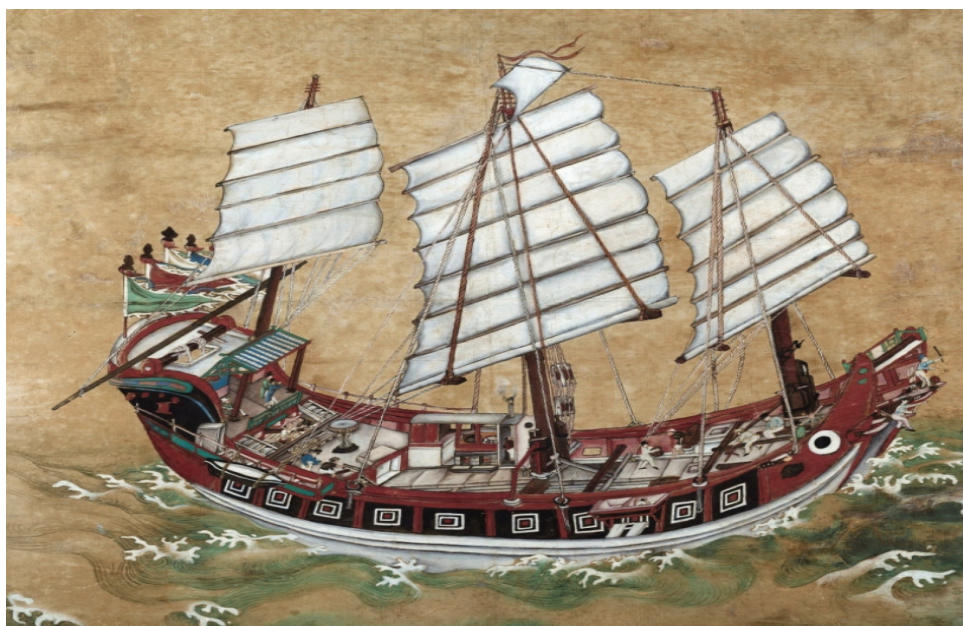
图 6:原十九世纪从广州前往南洋的著名帆船“耆英号” 88

在 1860 年以前，移民前往新加坡唯一的交通工具是乘坐帆船。那时的帆船主要依靠四角帆利用侧向风力航行，每面立帆都需要不断绕过桅杆以调节迎风角度，才可借助风力推动船只向前行驶（见图 6）。然而，这种船只存在的缺点是“若风水俱逆，则咫尺难移，而急谋下碇矣”。 87 简单来说，帆船只能顺风而行，无法在逆风的情况下行驶。因此，乘船下南洋的移民必须趁着东北季风之时启航，以便顺利航行。但由于海上的天气多变，遇到大风大浪时，船只可能会受损甚至造成船毁人亡。