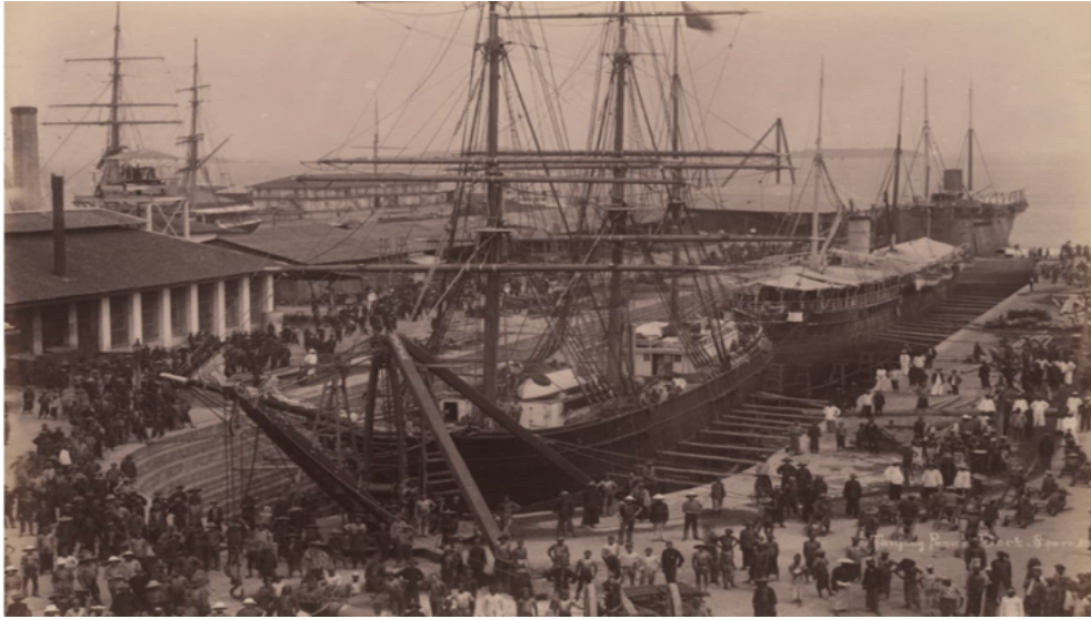
图 7:新加坡码头停靠蒸汽船 93

蒸汽轮的航行迅捷和安全性使它成为移民者首选的交通工具。与传统帆船相比,蒸汽轮船不受季候风的影响,无论是风水顺逆都能正常通航,航行时间更可控,从中国南下东南亚仅需六到八天即可抵达,极大缩短了航行时间。然而,乘坐传统帆船则需要依赖季候风的推动,航行时间更为漫长,尤其从中国南部到西印度群岛穿越太平洋,即使顺风航行也至少需要一百多天;而从中国港口启航前往新加坡的帆船,必须绕经海南岛,沿着越南东岸途径昆仑岛,再横跨海洋来到马来半岛后才抵达新加坡。在风向和海况稳定的情况下,这段航程需费时二十天左右。但若在海上行驶时,突然遇到天气突变转为逆风行驶,原本仅需二十天的航行就不得不延长至一个月,甚至要花费四十天才可抵达。 94