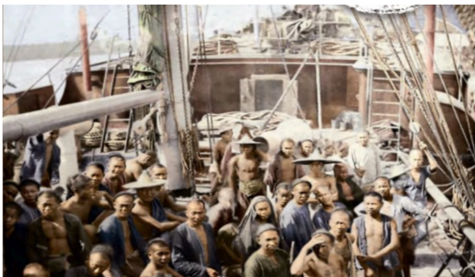
图 3：过番客们经历艰难长途航行的状态，资料来源：《徐宗懋与新加坡昨日情怀》封面 46

履险的情境。展区内的布置和灯光渲染，使得参观者有身临其境、穿越时空之感，进而更加深刻地体验和理解过番客冒着生命危险乘坐货船下南洋的艰难情境。来自台湾的徐宗懋在 2023 年举办的《新加坡的往日情怀》历史影像中，还向世人展示了过番客们在舱内生活的场景。其中多幅照片展现过番客们挤在空气窒息、疫病流行的船舱底层，他们衣食无着，病倒则无法就医。甚至，不少过番客因无法忍受长途航程，就此梦断黄泉。 45 此外，展览还展示了一副照片，揭示过番客们经历艰难长途航行后麻木、疲惫的状态。如图所示（见图 3），密密麻麻的过番客们挤在船只的甲板上等待通知下船，他们大多头缠长辫，身穿土布灰衣或赤裸上身，此时的他们个个表情麻木、倦怠和迷茫。因此，展馆中持续强调和再现移民过程中的艰辛叙事，会使观众对于海外华人的认知只停留在拥有相似的过番经历上，进而深化人们对先辈们过番艰苦的印象。然而，过多重复、单一、又相似的叙述，将导致人们对这类被构建出来的单一历史叙事麻木，使得人们不再深究这种有目的性的历史呈现方式的真实性。