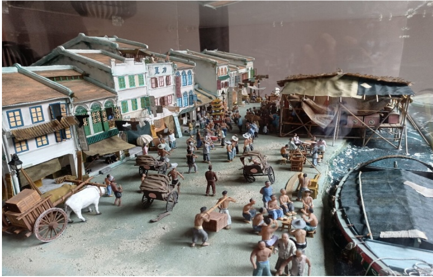
图 1：直落亚逸街旧貌模型：苦力劳工南来登陆的场景，资料来源：《联合早报》

综上所述，有关华人移民的叙述自 19 世纪中叶以来，无论是从专业的学术著作、报刊报道，还是展馆材料，叙述内容上都具有高度的相似性——倾向将华人移民的主体看成是劳工或契约劳工，从而影响后续研究学者和公众对华人移民群体的偏见。