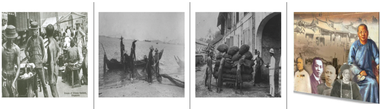
图 4：华人移民从事不同类型的工作，资料来源：新加坡国家图书馆“双城往事”展览 83

在 1848 年，移民者余有进 (Siah U. Chin) 在报告中提到，他在新加坡认识的同胞都在不同领域工作，有艰苦的体力劳动工作，如胡椒和甘比亚种植工人、渔民、泥瓦匠、船夫、铁匠；也有较为不费力的工作，如鞋匠、裁缝、杂货商、算命师和教师等。 81 到了 1879 年，英属海峡殖民地官员乔纳斯·丹尼尔·沃恩 (J.D. Vaughan) 在撰写他对海峡殖民地华人的调查时，他在文中披露华人从事的工作多达 105 个。其中包括人力车夫、小贩、渔民、船夫、收银员、医生和酒铺老板等，形成了多样化的社会阶层 (见图 4)。 82