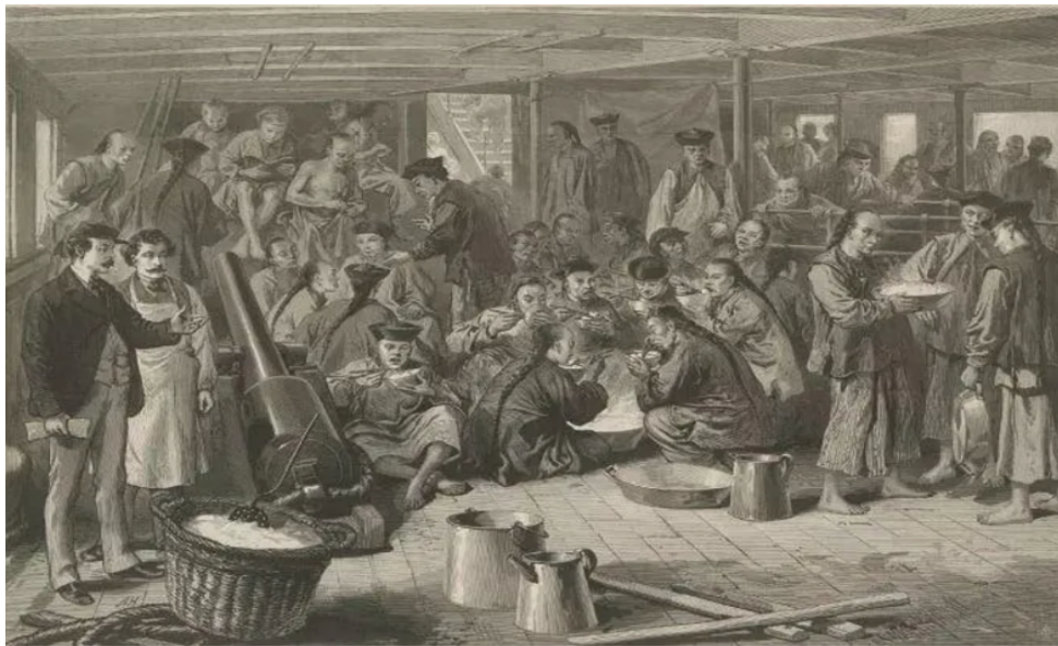
图 5: 船上用餐的情况，资料来源: The Graphic and Harper's Weekly 85

船只由人口贩运者所承包，为了多得利润，往往允许超载。致使船舱之内人满为患，移民们只能“日则并肩叠膝而坐，夜则交股架足而眠”。由于移民人数多，水供应不足，饮食通常也很差。食饭之际，皆以木盆盛饭，强者抢先或可果腹，他们像猪仔一样围盆强食（见图 5）。如遇到风头不顺之时，“晕船吐呕，狼籍满舱”则是常态，再加上“南洋酷热，上下蒸郁”，船舱内更是奇臭逼人。一旦有旅客感染上疾病，疾病迅速的蔓延，死亡率极高。故此种情形，凡贩运猪仔之船均如是也。 84