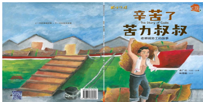
图8：《辛苦了，苦力叔叔》，资料来源：玲子网络书房

另外，新加坡儿童插画家兼童书作者余广达，特为新加坡开埠两百周年出版了《辛苦了，苦力叔叔》，作者通过绘本的形式生动地呈现了苦力劳工的故事，从小向年轻一代传递先辈们在艰难环境底下，仍“坚持奋斗”的精神。故事以“新加坡河”历史展开，向孩子们叙述了早期“下南洋”的先辈在码头间从事苦力工作的场景，使孩子们有机会深入了解先辈们过去的艰苦生活以及辛劳工作。通过富有启发性的故事，彰显苦力劳工们在国家建设中扮演的重要角色（见图8）。 160