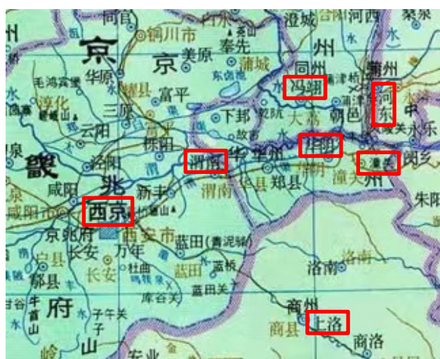
图一：唐代长安附近地图

再看“王穆”。其主角王穆至德初年为“鲁旻部将”，其军败于南阳，“军马奔走”，此后“军城寻为贼所围”——所叙败局困境，当正以至德元年五月至二年五月间，南阳节度使鲁旻率军艰守城池一年的南阳保卫战为背景 2 。文中“鲁旻”，当为鲁旻之形讹；而王穆奔亡罹难、又续首复还一事，当正发生于鲁旻收合残卒、退守城池之时。